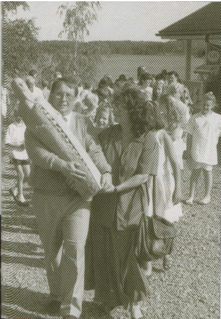
Under Svenska kyrkans Maria-dagar i Åmotsfors restes bl a en flera meter hög Madonna-staty utanför kyrkan.

som en motrörelse mot reformationen. Det fanns i fjol 38 jesuitpräster i Norden, 19 i Sverige och 19 i Danmark. I Norge var det fram till 1950-talet förbjudet för jesuiter att vistas.